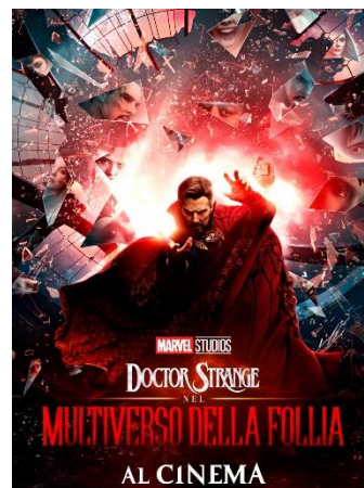
Doctor Strange nel Multiverso della Follia SAB. 28 16.00 20.30 DOM. 29 16.00 20.30