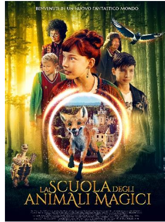
La scuola degli animali magici SAB. 21 16.00 DOM. 22 16.00