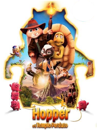
Hopper e il tempo perduto SAB. 14 16.00 DOM. 15 16.00