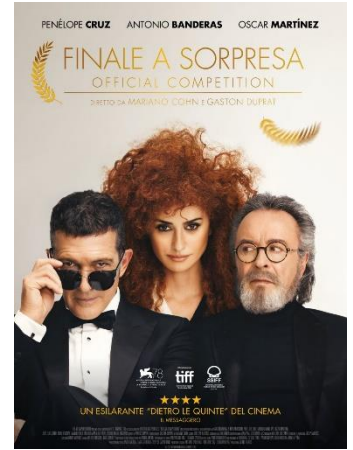
Finale a sorpresa SAB. 21 20.30 DOM. 22 20.30