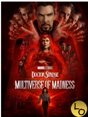
Doctor Strange in the Multiverse of Madness VEN. 27 20.30 Pellicola in lingua originale