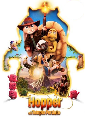
Hopper e il tempo perduto SAB. 07 16.00 DOM. 08 16.00