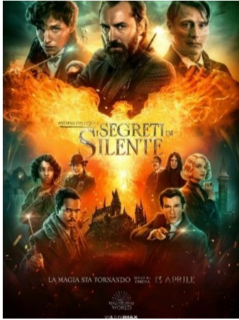
Animali Fantastici 3: I Segreti di Silente DOM. 01 16.00 20.30