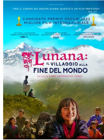
Lunana: il villaggio alla fine del mondo SAB. 07 20.30 DOM. 08 20.30